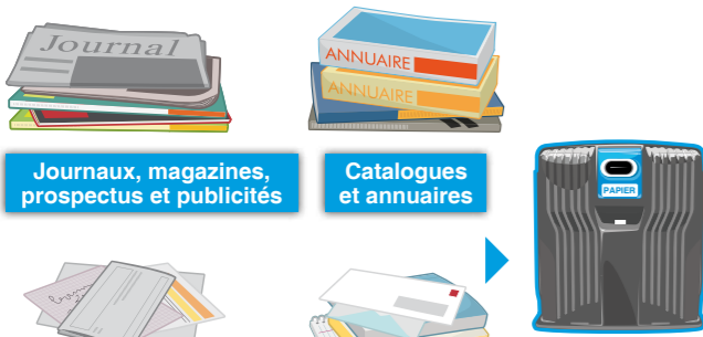
Journaux, magazines, prospectus et publicités